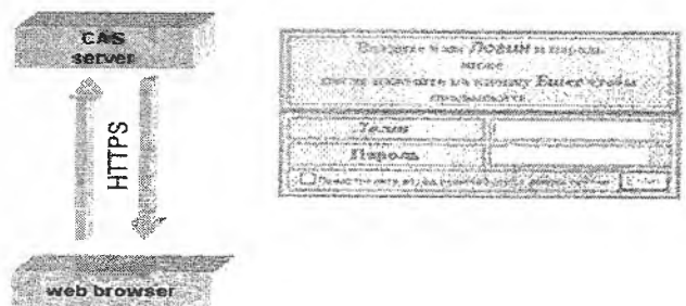
Рис. 2. Вход на сервер CAS через браузер.

Рассмотрим теперь технологию CAS для идентификации пользователя. На рис. 2. приведен первый вход на сервер CAS через интернет – браузер. Ранее не идентифицированный пользователь (или пользователь, чья идентификация еще находится в процессе ожидания), заходя на CAS сервер, представляет идентификационную форму, в которой его просят ввести netId и пароль.